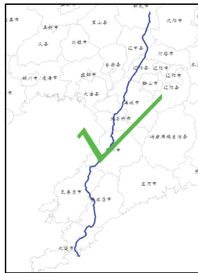
线路走向的细致表现

此外，通过长期的调研并结合各类公开文献，我们亦对管线的线路进行不间断的修正，来更加细致地体现出管道的宏观走向。