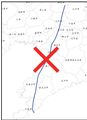
线路走向的粗放表现